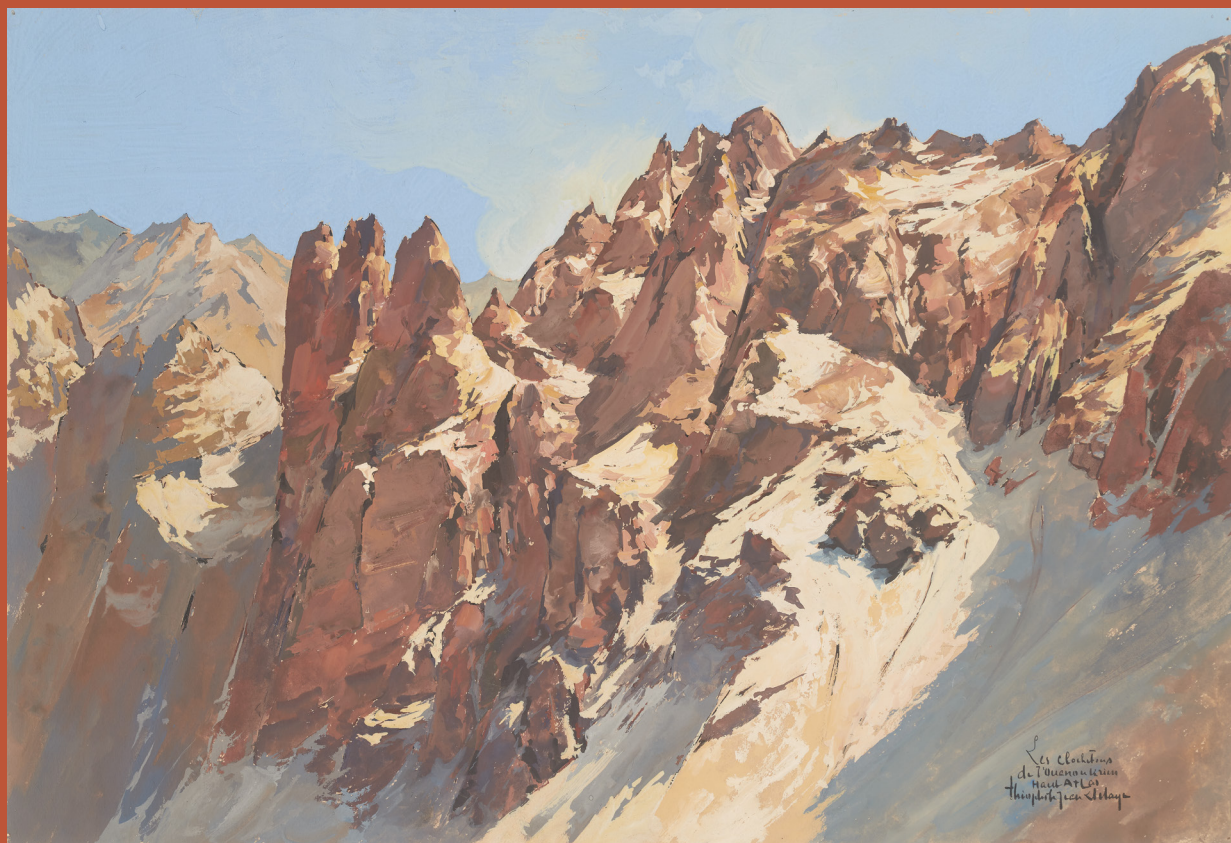
Théophile-Jean Delaye, Les échaubornes de Tinnoualrim, vers 1935, gouache, Marseille, Mucem, 2019.6.4.