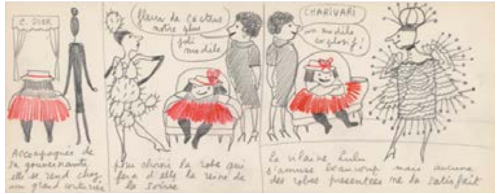
إيف سان لوران، اختيار صعب، 1956، رسم تخطيطي، قلم رصاص جرافيت وأقلام تلوين على ورق، 32.5 × 12.5 سم، متحف إيف سان لوران باريس

إيف سان لوران، "لولو الشقية"، باريس، إصدارات تشو، الإصدار الثاني 2003.