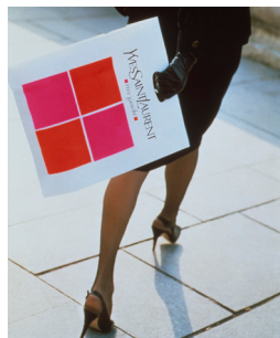
Image publicitaire réalisée pour SAINT LAURENT rive gauche